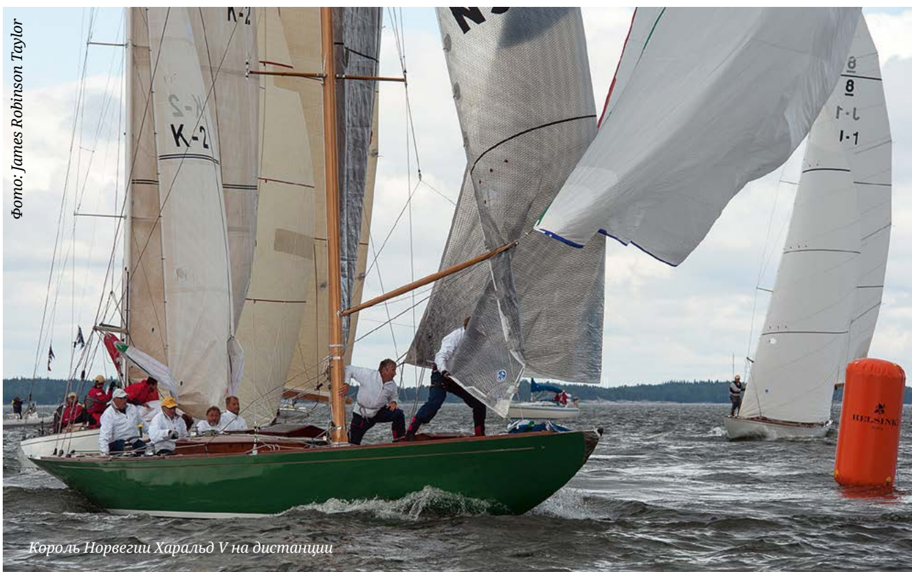
Король Норвегии Харальд V на дистанции